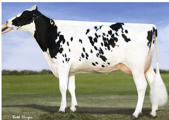
VISION-GEN SH SHO A12037 GRANDDAM